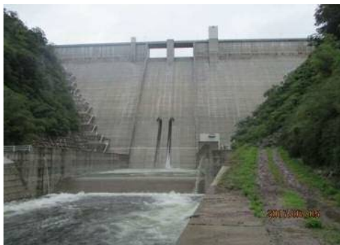
所在地: 島根県浜田市河内町