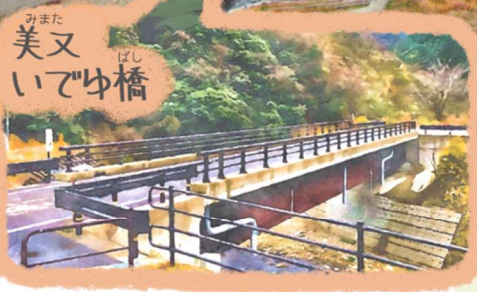
みまた 美又 いでゆ橋