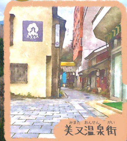
みまた おんせん がい 美又温泉街

はまだし じっし 浜田市が実施した 「美又地域再開発計画」 により整備されました。 2016年6月完成！