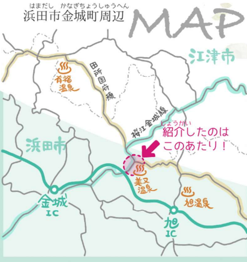
はまだし かなぎちょうしゅうへん 浜田市金城町周辺