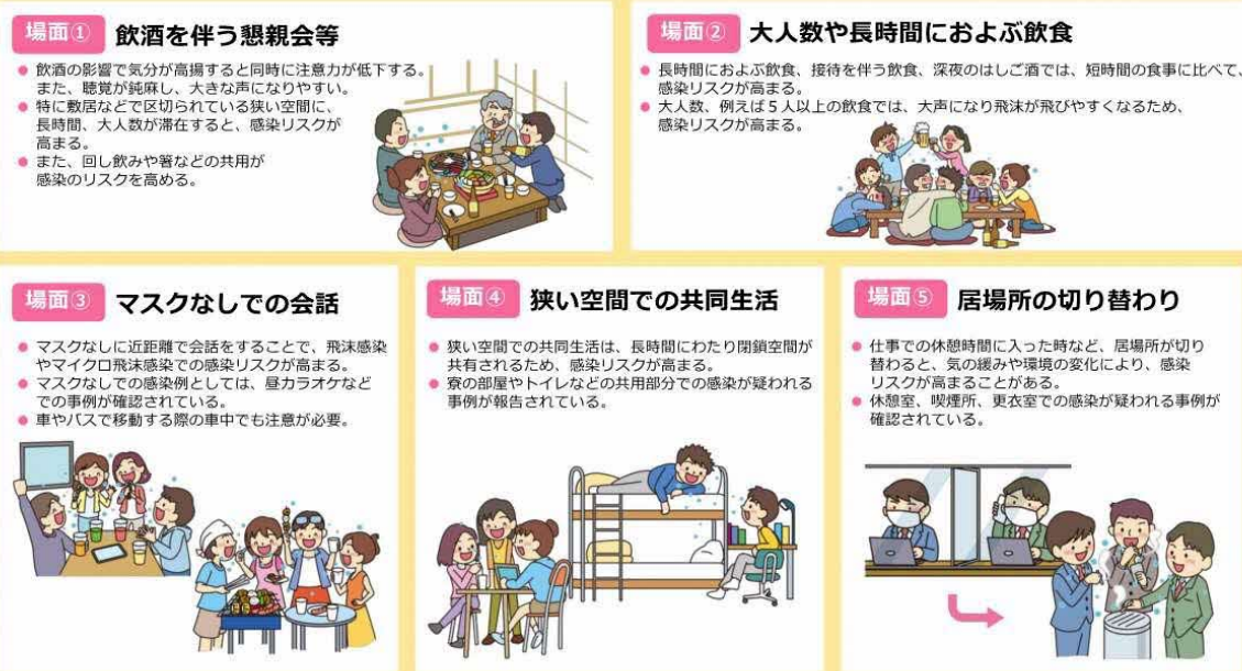
図2 感染リスクが高まる「5つの場面」（内閣官房のウェブサイトより一部抜粋）