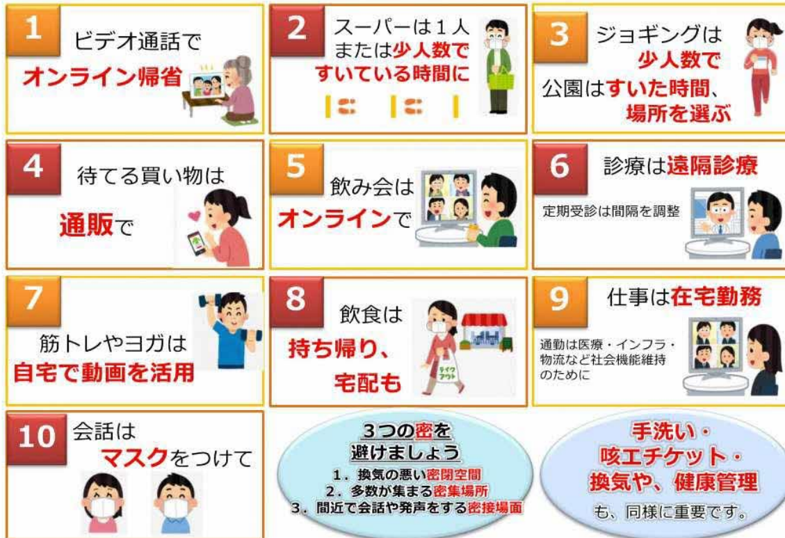
図1 人との接触を8割減らす、10のポイント（厚生労働省のウェブサイトより一部抜粋）

緊急事態宣言の中、誰もが感染するリスク、誰でも感染させるリスクがあります。 新型コロナウイルス感染症から、あなたと身近な人の命を守るよう、日常生活を見直してみましょう。