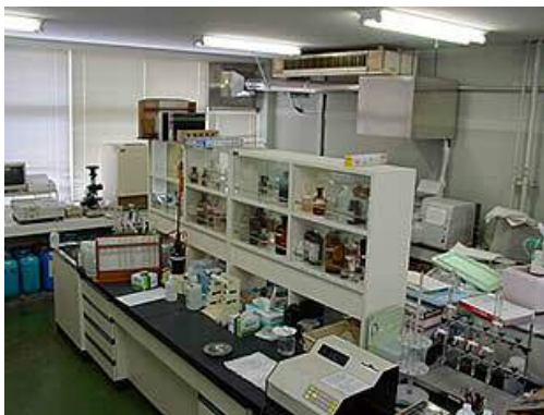
企業局東部事務所水質検査室

また、水質管理目標設定項目、クリプトスポリジウム及びジアルジア検査については前記検査機関への委託検査により実施します。