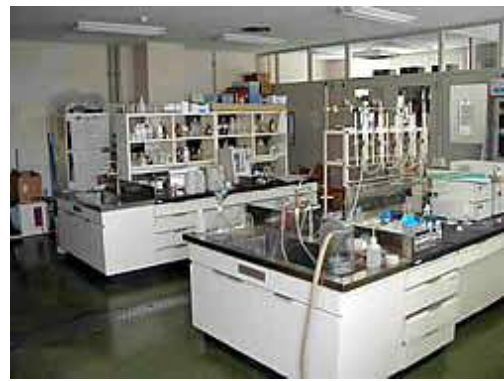
企業局西部事務所水質検査室