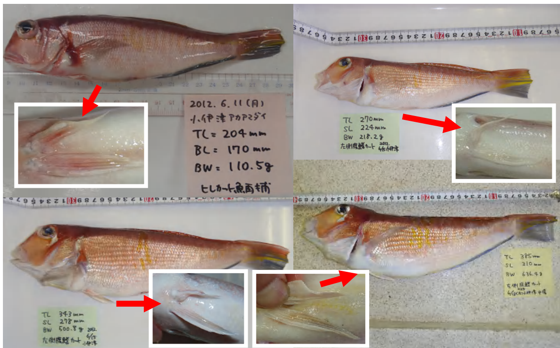
写真 1 再捕されたアカアマダイ(左上:6/11、右上と左下:6/15、右下:6/18)

島根県と出雲市では日本海区水産研究所宮津庁舎（旧日本栽培漁業協会宮津事業場）の協力により、平成 14 年度からアカアマダイの種苗放流を行ってきましたが、島根県で放流した魚の漁獲（以下再捕）はほとんど確認されませんでした。しかし今月の 6 月 11 日以降、続けて 4 尾の再捕が確認され、今後の再捕が期待されます（写真 1）。