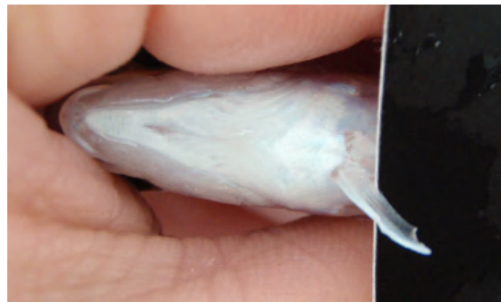
写真4 腹鰭のカット