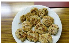
ハンバーグ(おなりもの)

今日はニギスの抹茶フライを食べますが、揚げ物以外にも色々な料理があります。ニギスは鮮度が落ちやすいため、練り物や干物などに加工して食べます。もちろん鮮度が良い時は刺身にもできますよ！