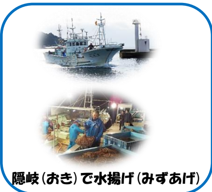
隠岐(おき)で水揚げ(みずあげ)

隠岐で漁獲されたエッチュウバイは、石川県金沢市に出荷され、高級品として扱われているのですが、みなさん知っていましたか。隠岐海域に生息しているエッチュウバイは、品質が良いと言われており、「おでん」などで食べられているようです。