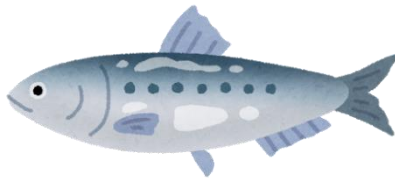
①さかなの切り身(きりみ)