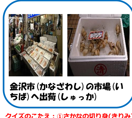
金沢市(かなざわし)の市場(いちば)へ出荷(しゅっか)