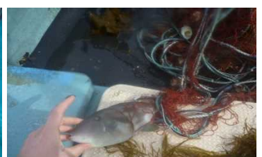
サカナがとれることも♪