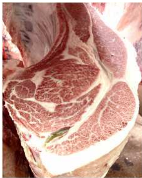
安福久-平茂勝-福栄、去勢 枝重555.6kg、ロース芯88cm 2 、 BMSNo.12