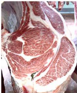
美国桜-美津照重-北茂勝96、去勢 枝重582.8kg、ロース芯110cm 2 、 BMSNo.12

※育種価(令和6年5月評価)の順位は、島根県で評価した全国の種雄牛393頭中の順位 ※総合評価は、枝肉重量：脂肪交雑：ロース芯を1：2：1の重み付けでの評価値