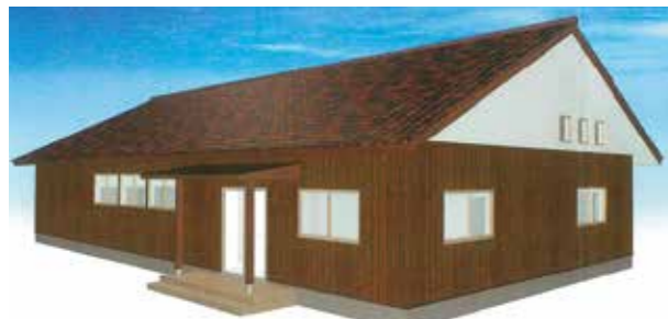
令和4年3月完成予定社屋イメージ写真

清流高津川を背景に、森林の有効活用を目指すとともに豊かな森林資源を一緒に守っていきませんか。