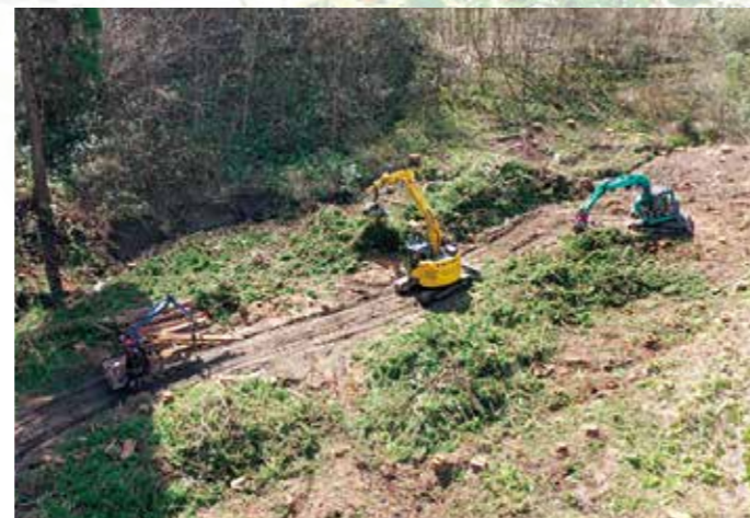
ドローンで撮影した伐採から再造林(一環作業)の様子