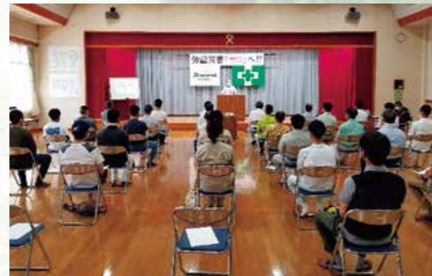
「労働災害ゼロへ」を目指して安全大会開催