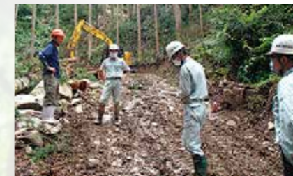
定期的な安全パトロール