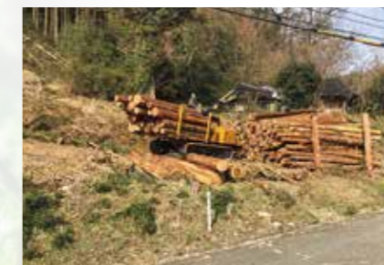
フォワーダによる運材作業