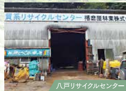
八戸リサイクルセンター