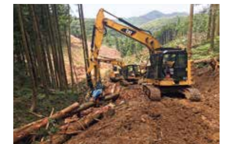
ハーベスタによる伐倒、造材作業