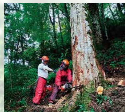
鳥取県日南町の大ケヤキの伐倒作業

これまでは多くの人手を要していましたが、大型重機などの機械化に取り組む事で、人件費の抑制、工期の短縮につなげています。また、現場から発生する木材については、「資源」としてとらえ、燃料のエネルギー源のほかに土壌改良剤のリサイクル活用を行っています。当社は地域の人たちの健康や社会に対して及ぼす影響について認識し、社会から評価して頂ける企業となるように努めており、ともに働いていける人材を求めます。