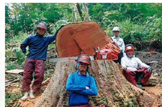
大ケヤキ伐倒後の記念撮影