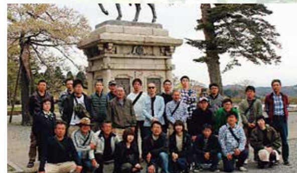
社員旅行(仙台にて)