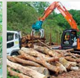
グラブによる積込作業