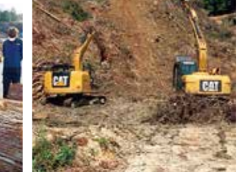
スイングヤードによる集材作業