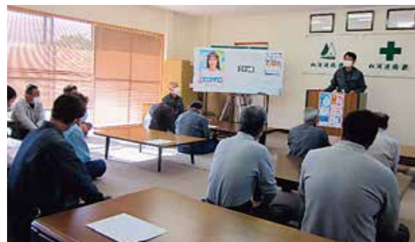
安全大会(毎月1日開催)