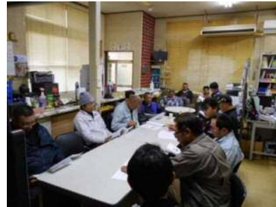
作業前ミーティング