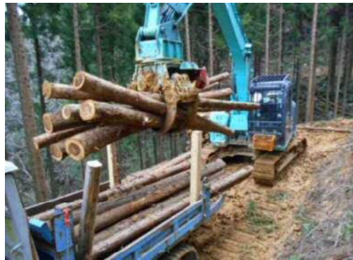
グラブによる原木積込作業