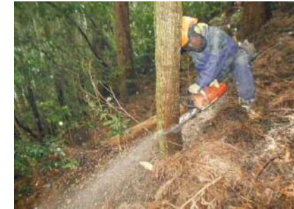
チェーンソーによる伐倒作業