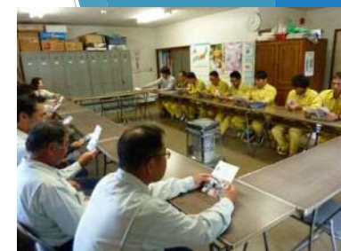
安全衛生大会の開催状況