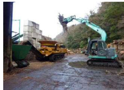
移動式チップパーによる バイオマス発電用チップの生産作業