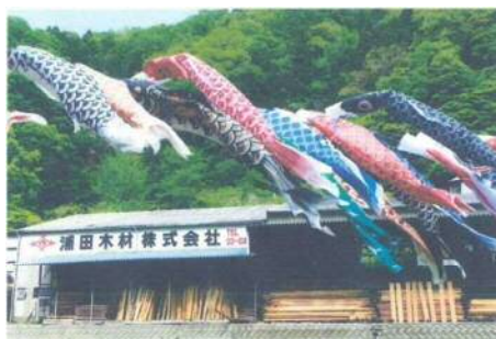
会社及び製材工場家屋