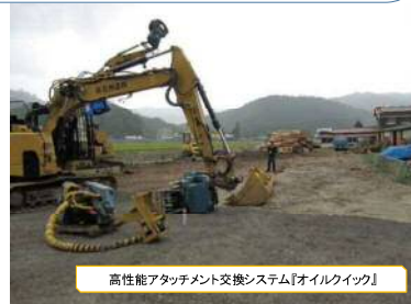
高性能アタッチメント交換システム『オイルクイック』