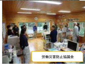
労働災害防止協議会