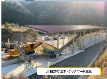
津和野町原木・チップヤード施設