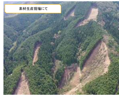
素材生産現場にて