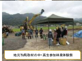
地元TV局取材の中・高生参加林業体験祭