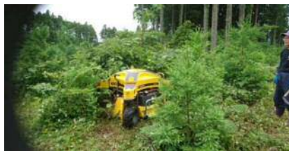
H30導入ラジコン式草刈り機(Pro ILD01) 下刈り作業の大幅な軽減につながっている