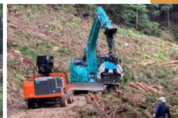
R2導入ホイール型フォワーダ(3t) R3～リース導入プロセッサ(13t)