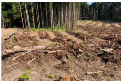
伐採後の植林の状況

任された山林を立派な森に育て、山林所有者さんに少しでも喜んでもらえるよう取り組んでいきたいと思っております。