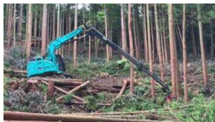
R2導入ロングリーチ伐倒ソー(16t) 伐採範囲15m、最大伐倒径60cm