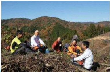
みんなで集まって休憩