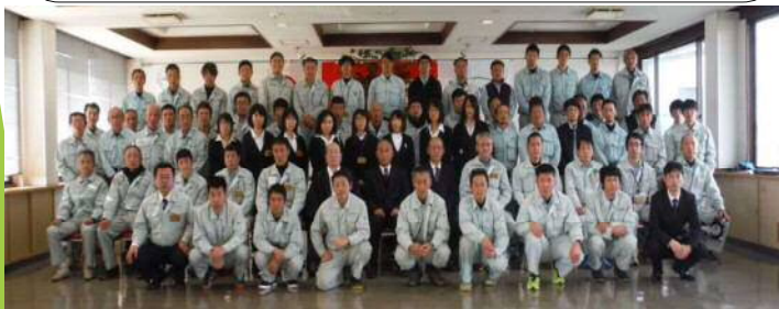
安全祈願祭(令和2年1月)

当森林組合は、平成30年に合併20周年を迎えました。20周年記念事業の一環として、出雲地区独自の再造林支援事業を県・市・伐採業者と共に取り組むことにしました。これからの林業は、伐採とその後の再造林を通じて再び成長できるのではないのでしょうか。そのため現場で働く気のある従業員を求めています。若い人の力がこれからの林業には必要です。 「伐って・使って・植えて・育てる」循環型林業を実行するには様々なハードルが立ちはだかっていますが、今後一つずつ取り組んでいきます。地域の林業の担い手にご支援のほどお願いします。