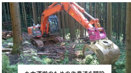
丸太運搬のための作業道を開設