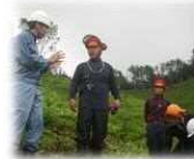
まずは安全第一 安全ハットロール実施中