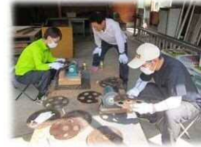
ていねいな新人研修制度あります