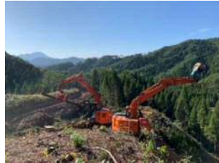
高性能林業機械による主伐