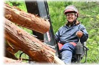
女性モリトも活躍中

合併30周年の記念事業として計画しておりました植樹を多数の参加者の皆様とともに行うことができました！