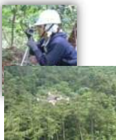
森林調査・測量作業