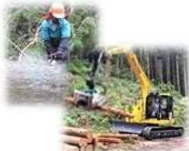
造材・玉伐り作業