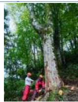
鳥根県日南町の大ケヤキの伐倒作業

当社は、安全第一、工期の合理的な短縮、施工品質保証に努めてその業務を遂行しています。これまでは多くの人手を要していましたが、大型重機などの機械化に取り組む事で、人件費の抑制、工期の短縮につなげています。また、現場から発生する木材については、「資源」としてとらえ、燃料のエネルギーのほかに土壌改良剤のリサイクル活用を行っています。当社は地域の人たちの健康や社会に対して及ぼす影響について認識し、社会から評価して頂ける企業となるように努めており、ともに働いていける人材を求めます。