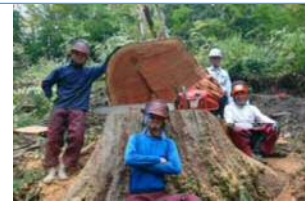
大ケヤキ伐倒後の記念撮影