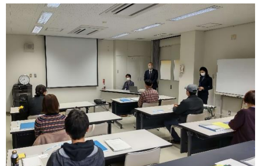
令和4年度 移植師養成講習会の風景