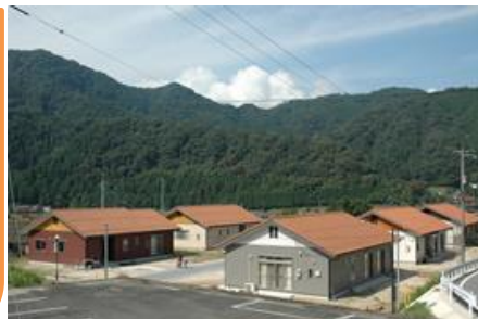
若者定住住宅 (現在45棟を建設している)

Uターン者への定住ポイント制度や、子育て支援策も充実しており、保育料・医療費の無料化、学校給食費の軽減など定住を応援しています。