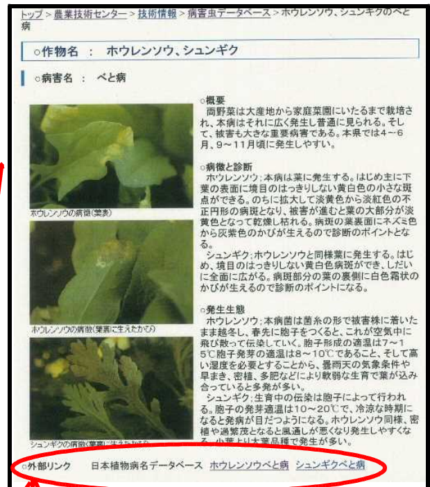
図2 病害虫データベース 具体例（ハウレンソウ、 シュンギクべと病） 外部リンク