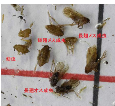
株元につくトビイロウンカ 粘着板への払い落とし(トビイロウンカ成幼虫)

防除に当たっては、農薬の使用基準（適用作物、使用量又は濃度、使用時期、総使用回数）を遵守してください。