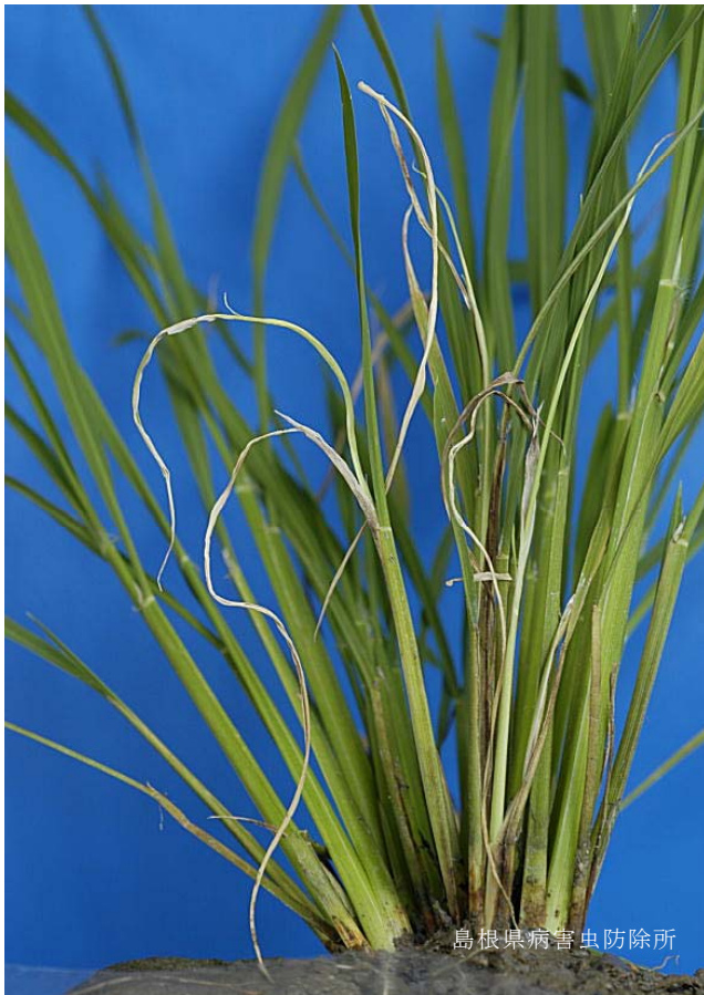
病原ウイルスが検出されたコシヒカリ