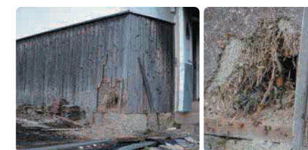
ハチの巣を狙って壊された建物

住居周辺にできたハチの巣を狙ってクマが出没することがあります。専門業者に依頼するなどしてハチの巣を除去しましょう。