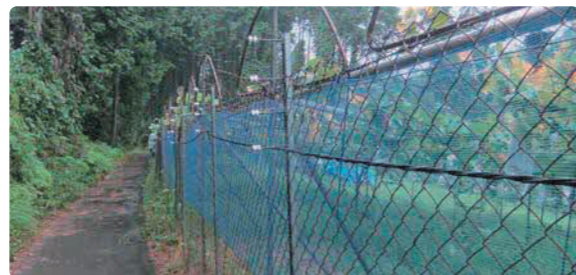
侵入防止柵の設置

果実を放置するとクマを誘引してしまいます。掘り返されないよう土中に深く埋めるか業者に回収してもらうなど適切に処理しましょう。