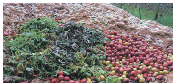
屋外に放置された果実