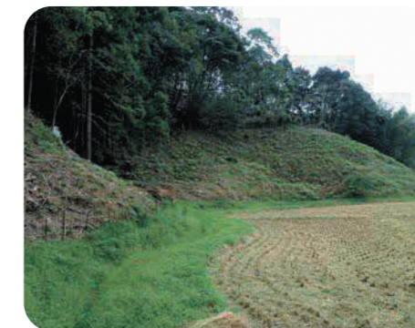
林縁の藪刈り払いの様子

※環境整備は継続することが重要になりますので、地域でよく話し合ってから実施することをお勧めします。