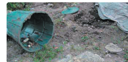
荒らされたコンポスト

生ごみを入れたコンポストはクマを誘引するため、出沒のおそれのある地域では電気柵等で対策を行うか、使用しないことをお勧めします。また、ごみ出しはできるだけ収集の直前に行いましょう。