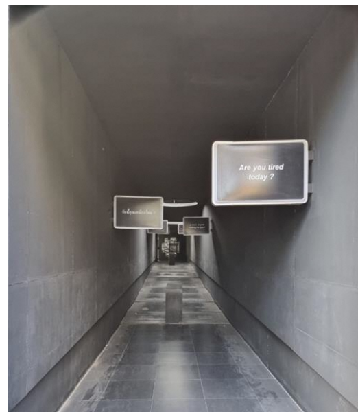
カフェ入り口の人生の意味を問いかけるトンネル

入り口には、「Are you tired today?（あなたは今日、疲れていますか？）」や「Is there anyone waiting for you?（あなたを待っている人はいますか？）」、「What are you working hard for?（あなたはなんのためにそんなにハードに働いているのですか？）」など、人生の意味について問いかけるトンネルが設けられています。