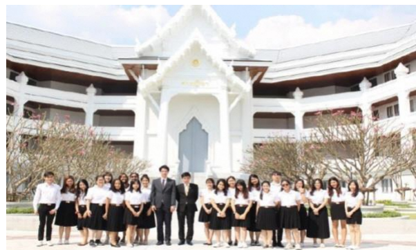
タイの最高裁判所

この憲法に準拠する司法制度としては 以下の4つの裁判所が核となります。これらはすべて並列で、どの裁判所でも取り扱わない案件はすべて（1）の司法裁判所の管轄となります。なお、タイの裁判所は陪審制ではなく、職業裁判官により審理されます。