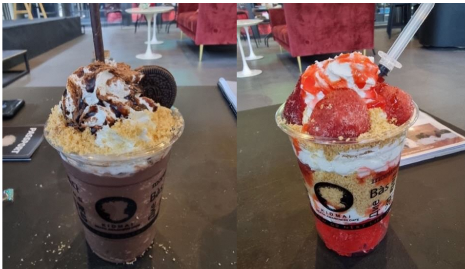
左：チョコレートパフェ「Death（死）」 右：いちごパフェ「Painful（痛み）」

このカフェでは、ただコーヒーを楽しむだけでなく、「死」について考えさせられる体験ができます。メニューの名前もテーマに沿ってつけられており、「誕生」「痛み」「老い」「死」など独特な名前が並びます。