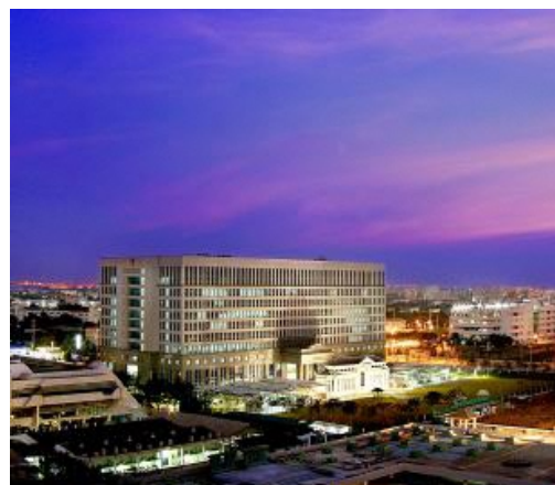
タイの行政裁判所

タイに限らず海外との紛争に巻き込まれた場合は、提起する場所の決定が必要です。通常は、判決による強制執行権を行使しやすい国を選びます。タイか日本か、第三国かの内、判決に基づき、財産を差し押さえることが出来き、準拠法の言語に親和性がある国を選びます。タイ企業において、日本に押える資産を持つタイ人というのは稀ですので、タイで提起することが圧倒的に多くなります。