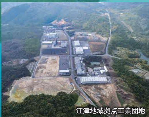
江津地域拠点工業団地