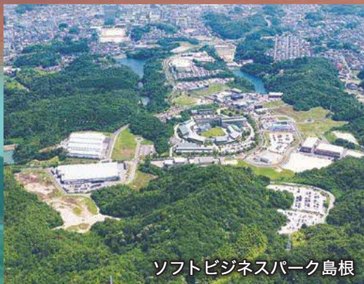
ソフトビジネスパーク島根