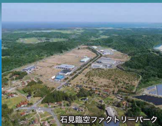
石見臨空ファクトリーパーク