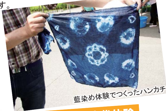
藍染め体験でつくったハンカチ