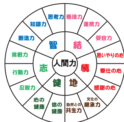
海士町“人間力マップ”

何とどう出会い、かかわっていくかを分析・検討したうえで、子どもたちの成長の段階において必要な体験活動を、学校・家庭・地域が連携して行っています。今回は小学4年生・小学校高学年・中学2年生で実践されている体験活動を紹介します。