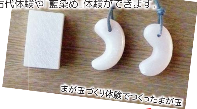
まが玉づくり体験でつくったまが玉

また、みなさんのご希望に応じて、「まが玉づくり」、石膏を使った「銅鐸づくり」などの古代体験や「藍染め」体験ができます。