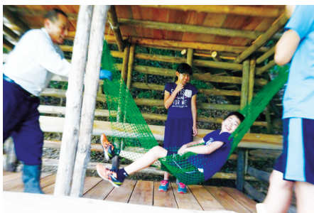
ハンモックで遊ぶ子どもたち

提言書は、「せっかく選ばれたのだから何か形に残るような活動をしよう」という委員の社会教育に対する思いの結晶です。ざくばらんに意見を交わし、いつも賑やかで中身の濃い協議を重ねてくれました。さらに、できることから始めようと、委員自らそれぞれの立場で「人づくり」に向けて取り組んでおられます。まさに、社会教育流儀を地で行く社会教育委員です。 (出雲教育事務所 奥出雲町派遣社会教育主事)