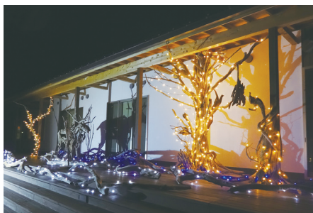
いかあ屋応援団作製のイルミネーション

図書館建設計画段階から住民参加型の集まり（縁側カフェ）が開催されており、図書館機能だけでなく住民の活動拠点として、とてもすてきな空間となっています。何かをしてみよう側から、何かをする側へと意識が変化している「いかあ屋応援団」の皆さん。集い、動くことの楽しさを知る仲間がさらに増え、地域づくりを担う人が増えることが期待されます。 (隠岐教育事務所 社会教育スタッフ企画幹)