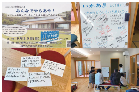
縁側カフェの様子

現在は、「図書館」というテーマに基づいた活動に限られていますが、いずれは、参画することの楽しさを知った住民の取組が、町全体に広がっていくことを期待しています。