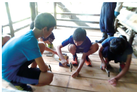
ツリーハウス作り

今年、地域の多様な人材を巻き込んでお寺の裏山にツリーハウスを造りました。「2階建てがいいな、ハンモックも、階段やはしごも、庭にはブランコやゆりりもほしい。」子どもたちのアイデアはどんどん膨らみます。地域の人から「はで木」をもらい、大工さん、高校生、専門学校生、保護者など様々な人たちが子どもたちとつながることで、夢の遊び場が完成しました。