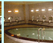
浴室 定員:大50名・中25名