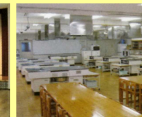
調理室・試食室 定員:40名