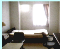
リーダー室 シングル:5室 ツイン2室