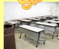
研修室 定員:40名 4室 20名・60名 各1室