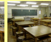
創作室 定員:40名 2室