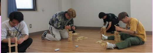
講義「子どもの体験活動とその支援」