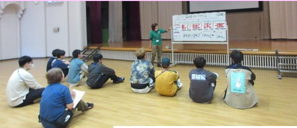
なかまづくりゲームの体験