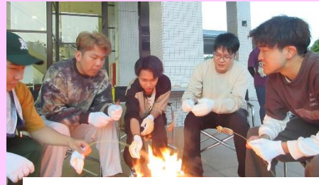
フリータイム「たき火・ニュースポーツ」