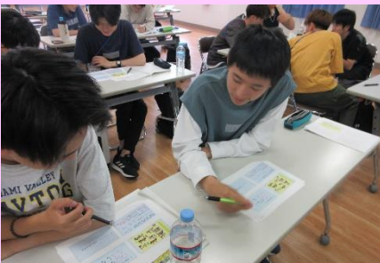
講義・演習「体験活動とリスクマネジメント」