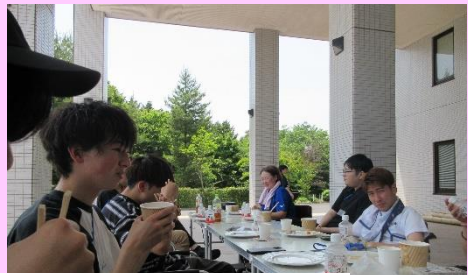
演習「火起こし・野外炊飯」