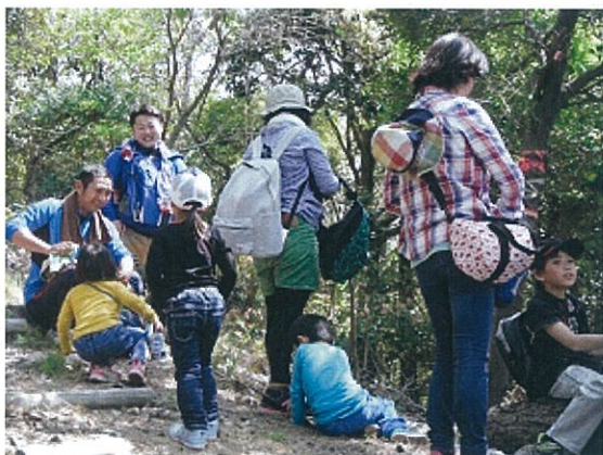
鳶ヶ巣登山 (親子遊び)