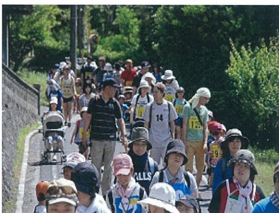
健康ウォーク (障がい者交流)