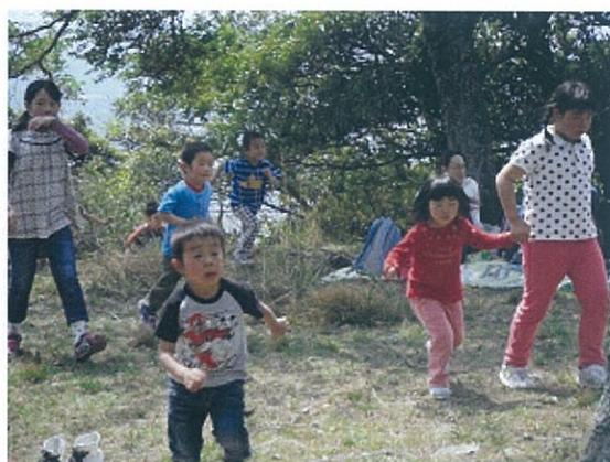
鳶ヶ巣登山 宝さがし