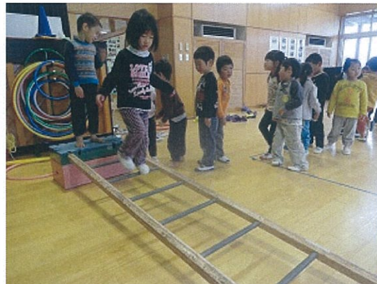
運動遊び (バランス)