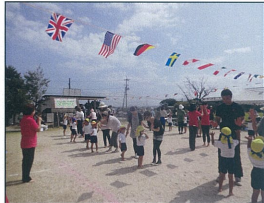
運動会 (お家の人と一緒にフォークダンス)