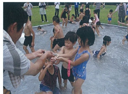
鮎のつかみどり (父親との遊び)