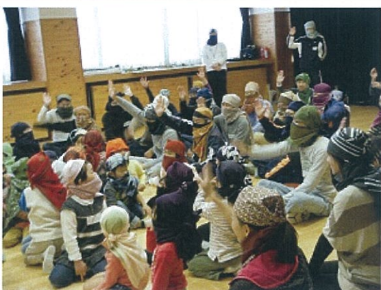
まるごと忍者体験 (父親との遊び)