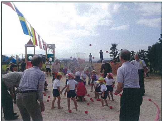
運動会 (地域の方と玉入れ勝負)