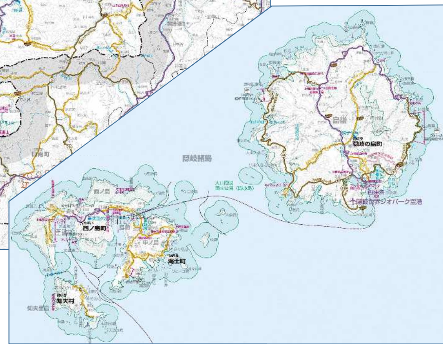
【参考図面 1 / 2】