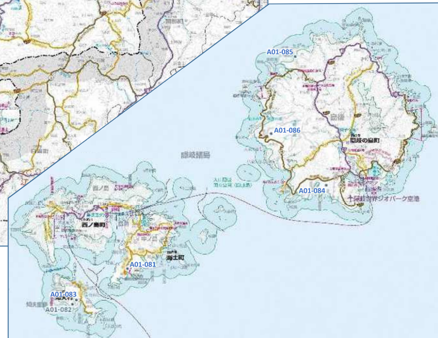
【参考図面 1 / 2】