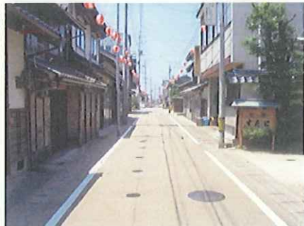
既存道路の美装化(市道)