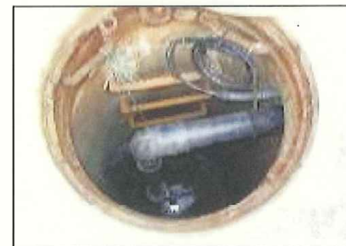
マンホール内の可搬式ポンプ