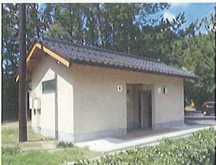
公園トイレのバリアフリー化