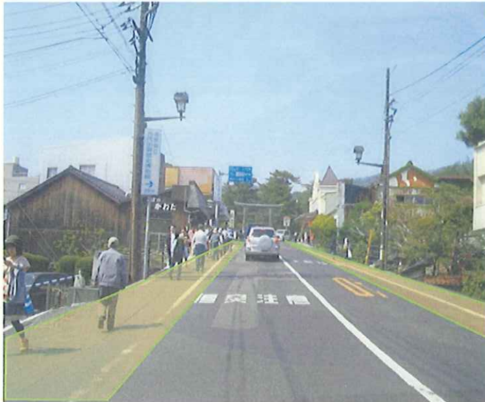
幹線道路の歩道新設(県道)

幹線道路の歩行空間を拡幅設置することにより、 出雲大社門前町のにぎわいの創出を支援