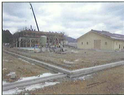
処理場の増設・改築