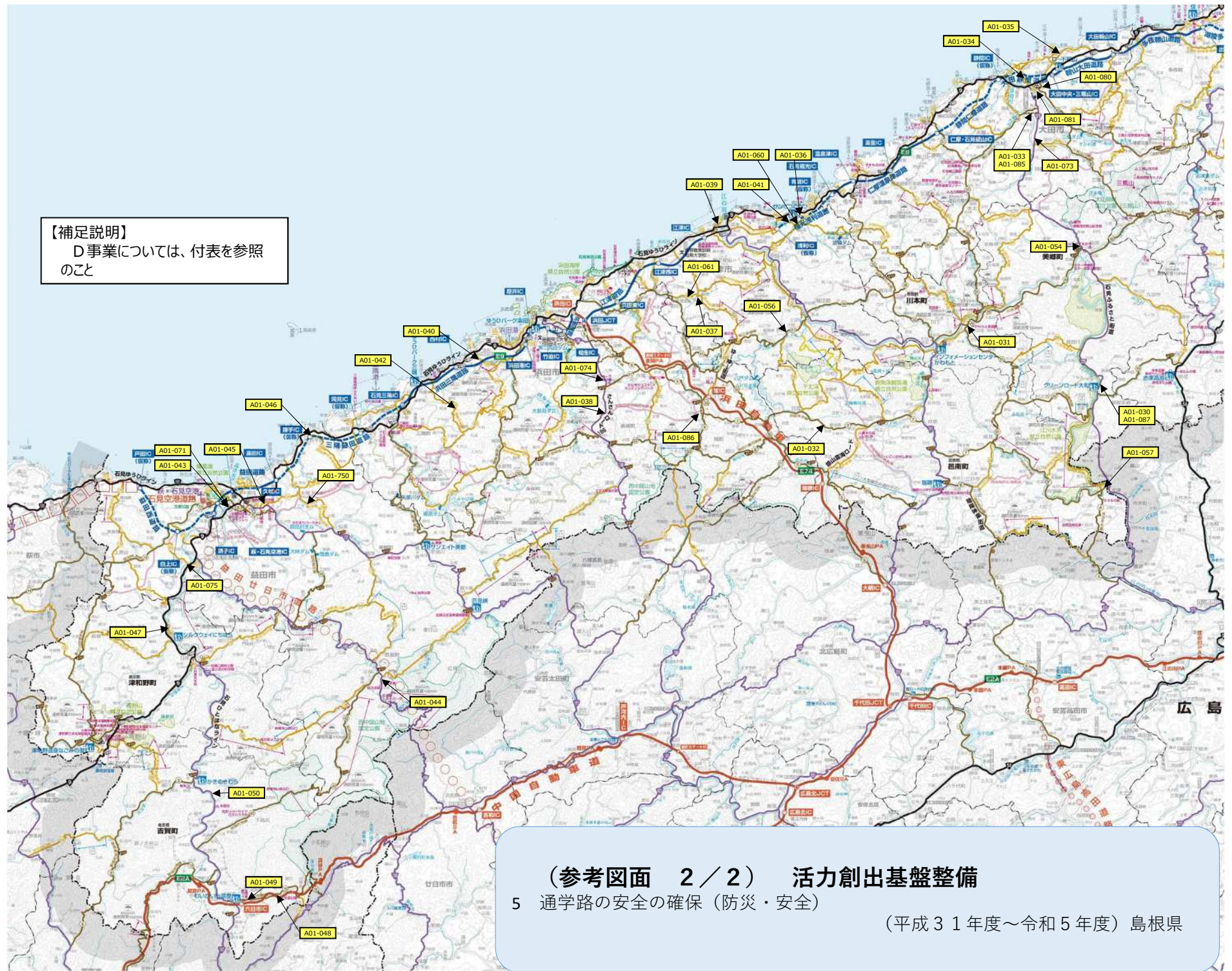
(参考図面 2 / 2) 活力創出基盤整備 5 通学路の安全の確保 (防災・安全) (平成31年度～令和5年度) 島根県