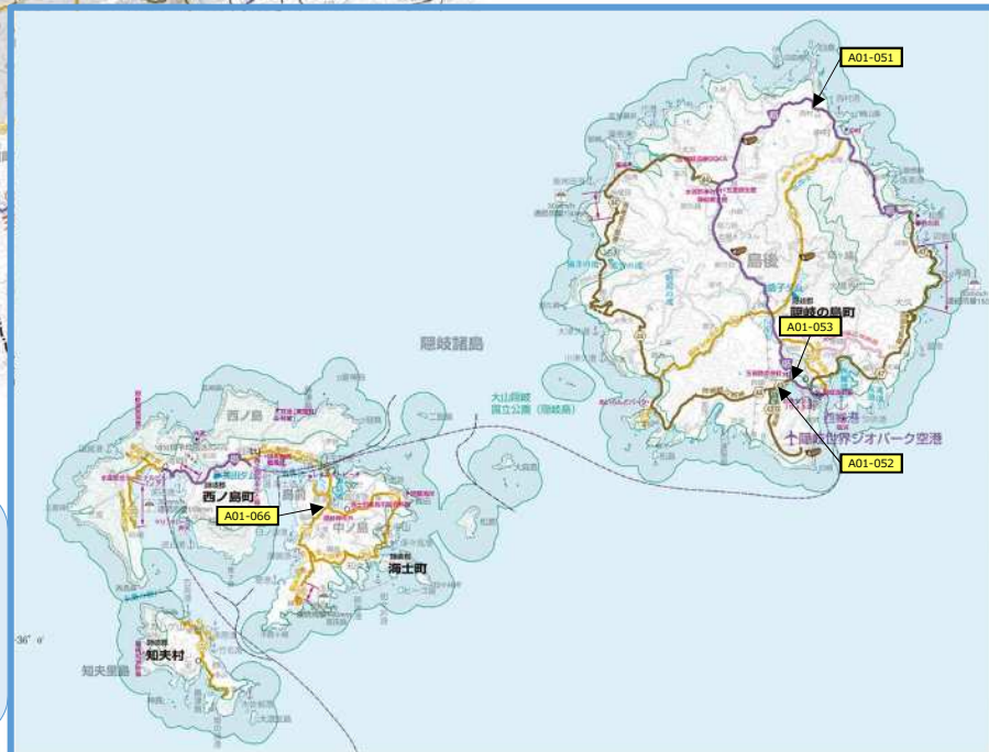
(参考図面 1 / 2) 活力創出基盤整備 5 通学路の安全の確保 (防災・安全) (平成31年度~令和5年度) 島根県