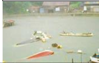
Mga nasirang bangka gawa ng Tsunami-

Pagkatapos ng tsunami, naging sanhi noong July 1993 sa Southwest Hokkaido Earthquake (yumanig ng 7.8), may mga bubong at sakahang nasira sa rehiyon ng Oki at sa Shimane Peninsula.