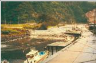
Dumating na tsunami sa ilog