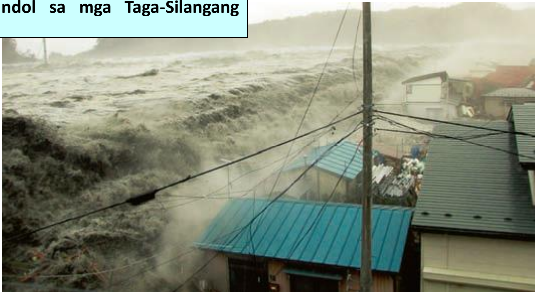
Sinira ng Tsunami ang Pilapil (small dike)