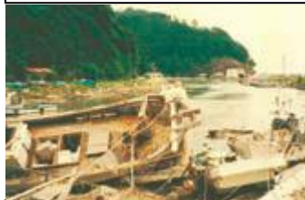
Mga nasirang bangka gawa ng Tsunami

Pagkatapos ng Tsunami,naging sanhi nung May 1983 sa Mid-Japan Sea Earthquake off the coast ng Akita Prefecture (yumanig ng 7.7),mayroong mga nasirang bubong, bangka at mga pasilidad sa daungan ng rehiyon ng Oki at sa Shimane Peninsula.