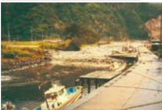
Из-за цунами река вышла из берегов