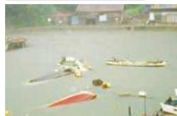
Пострадавшие от цунами лодки

Волна цунами, образовавшаяся в результате землетрясения магнитудой 7,8 балла неподалеку от юго-запада Хоккайдо, вызвала разрушения жилых домов и участков сельского и рыбного хозяйства округа Сима-тэ, о.Оки