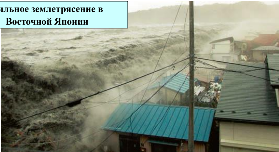
Волна цунами преодолевает волнорезы и смывает городок на побережье