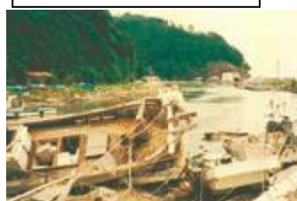
Danos nos barcos causado pelo tsunami.

O terremoto que ocorreu em maio de 1983, de magnitude 7.7, próximo do mar da província de Akita causaram o tsunami, provocando inundações nas casas e danos nos barcos da região de Oki na península de Shimane.