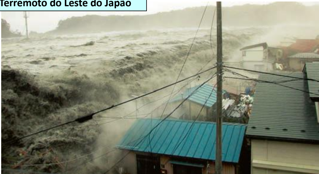
Tsunami avança o dique e chega na cidade.

Para se proteger de tsunami é necessário estar preparado e se refugiar rapidamente.