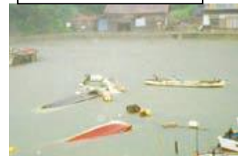
Danos nos barcos causado pelo tsunami.

O terremoto que ocorreu em julho de 1993, de magnitude 7.8, próximo de Hokkaido causaram o tsunami, provocando inundações nas casas, danos nos arrozais, plantações e barcos pesqueiros da região de Oki na península de Shimane.