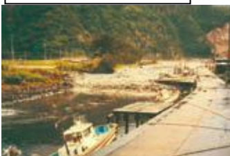
Tsunami avançando o rio.