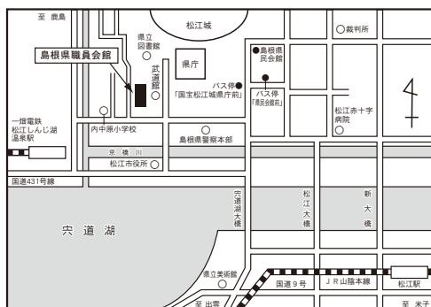
松江試験場案内図