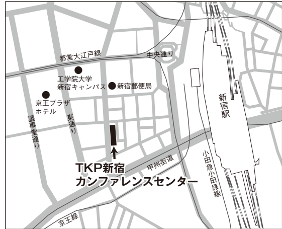
東京試験場案内図

住 所：新宿区西新宿1-14-11 Daiwa西新宿ビル アクセス：JR山手線「新宿駅」新宿駅南口 徒歩約5分 JR中央線「新宿駅」新宿駅南口 徒歩約5分 JR埼京線「新宿駅」新宿駅南口 徒歩約5分 京王線「新宿駅」新宿駅西口 徒歩約5分 小田急線「新宿駅」新宿駅西口 徒歩約5分