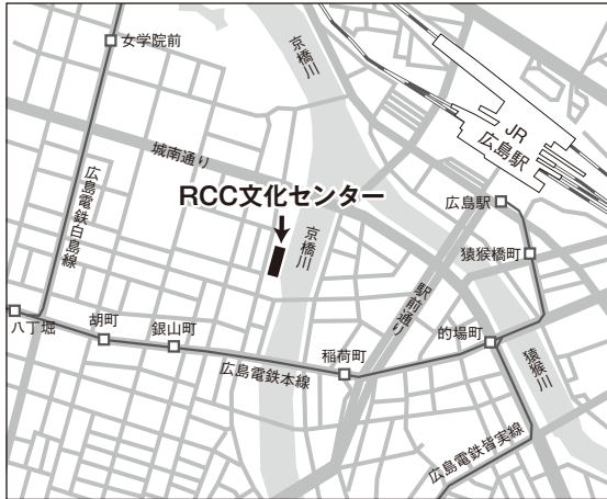
広島試験場案内図

住 所：広島市中区橋本町5-11 アクセス：広島駅（南口・在来線口）から徒歩10分 広電銀山町電停から徒歩5分