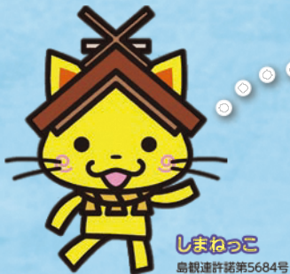
しまねっこ 鳥観連許諾第5684号