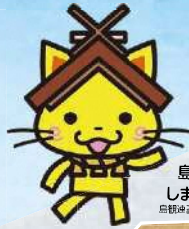
島根県 しまねっこ 登録商標特許第5684号