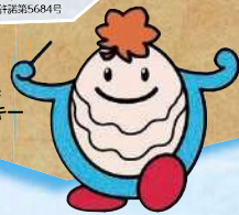
広島県 ブンカッキー