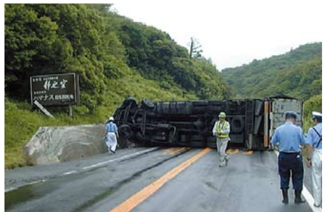
▲事故・災害時の代替道路として機能