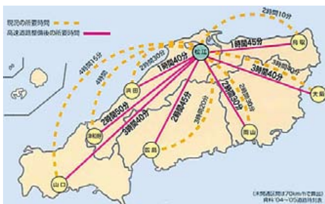
▲移動時間の大幅な短縮効果