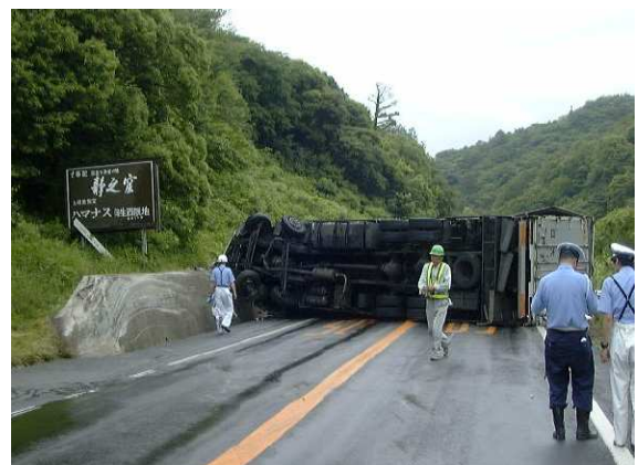
事故・災害時の代替道路として機能