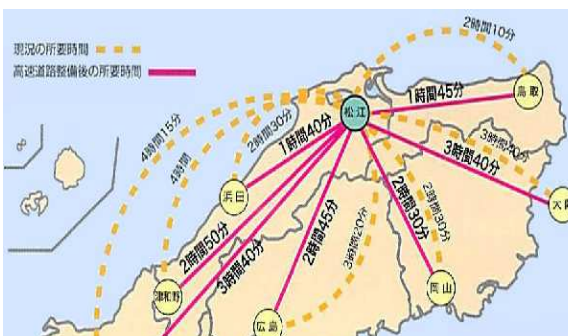
移動時間の大幅な短縮効果