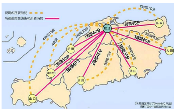
移動時間の大幅な短縮効果