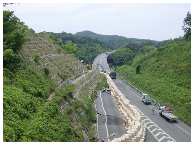
山陰自動車道被災現場 (H18.7.18)

URL : http://www.pref.shimane.jp/section/highway/