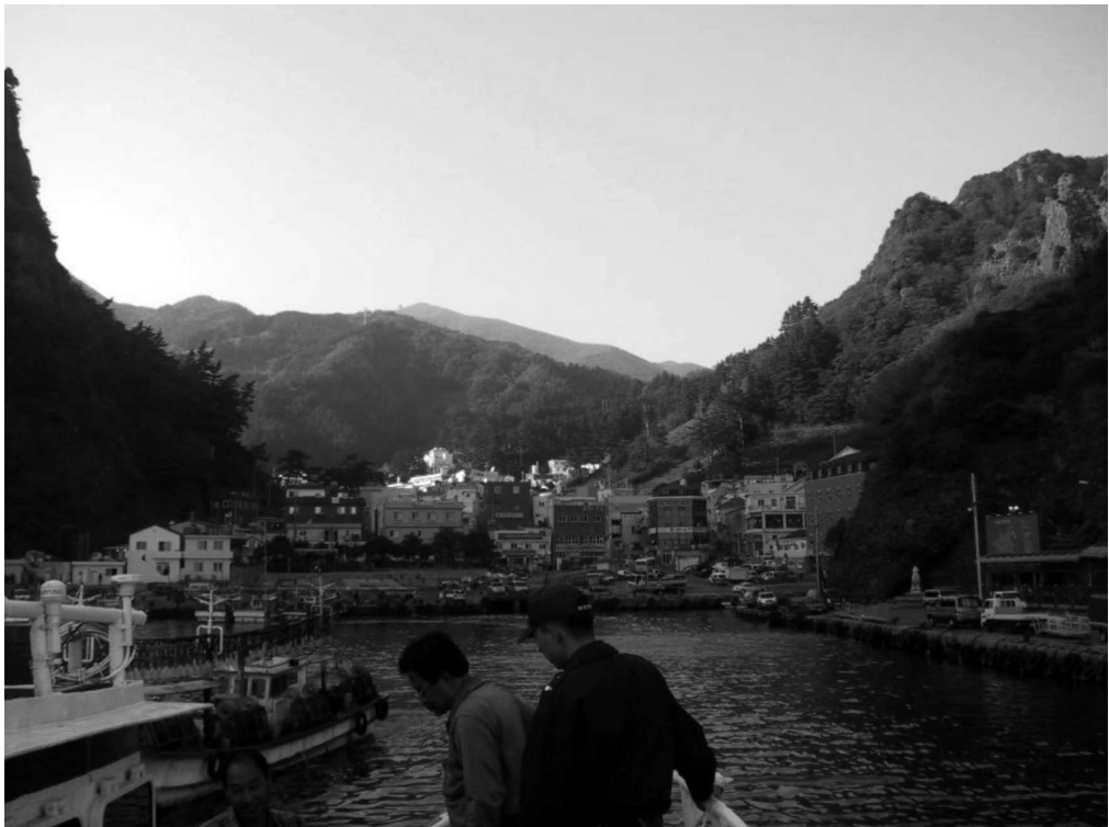
写真4-4 道洞（観光船より撮影）