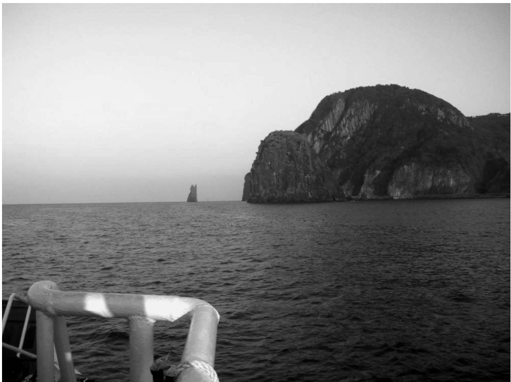
写真4-20 一本立島（竹岩）（観光船より撮影） 島の手前にある岩である