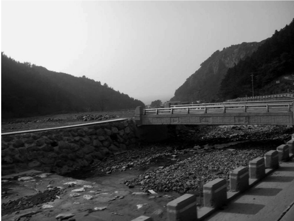
写真4-1 台霞川（島内一周道路より撮影）