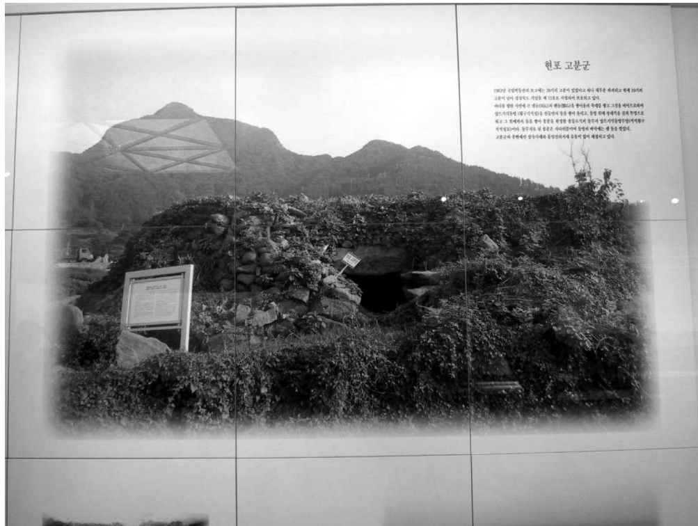
写真4-17 鬱陵島の古墳（鬱陵島・郷土資料館の展示写真）