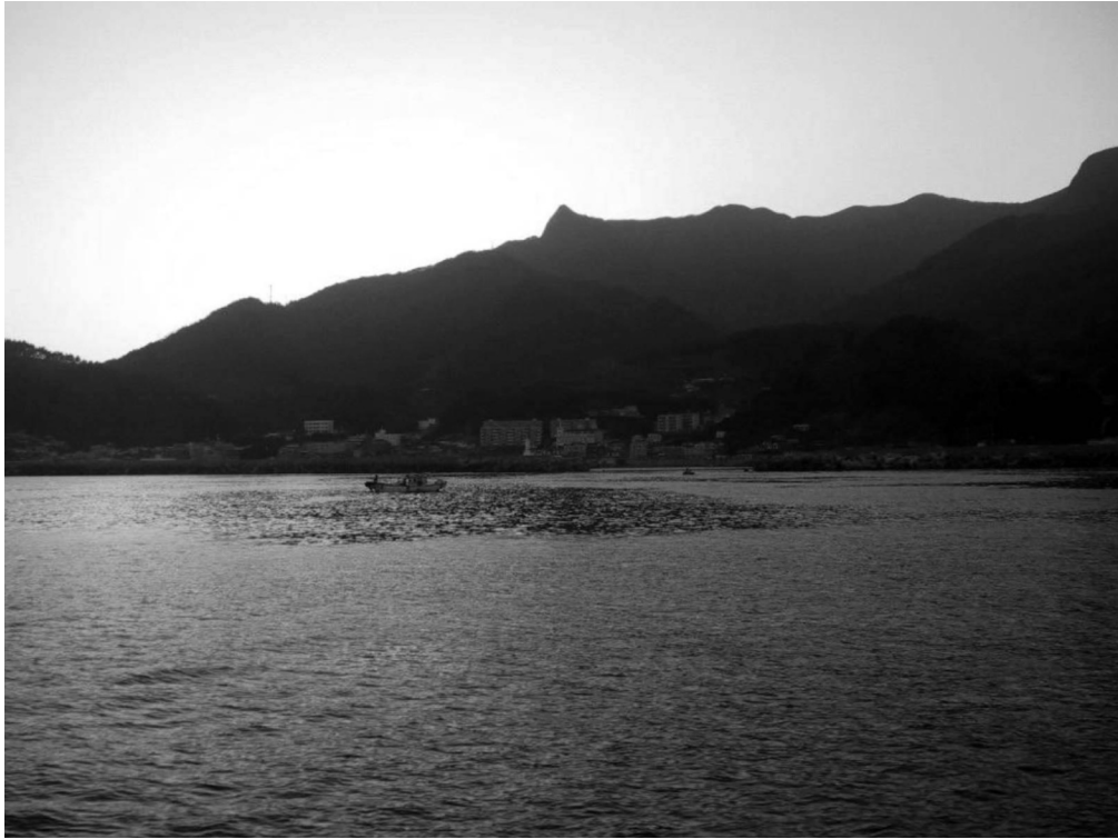
写真4-5 苧洞（観光船より撮影）