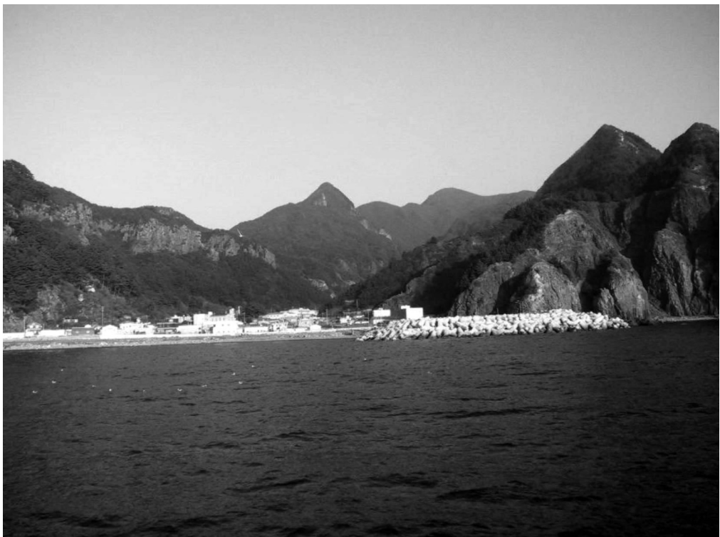
写真4-8 台霞（観光船より撮影）