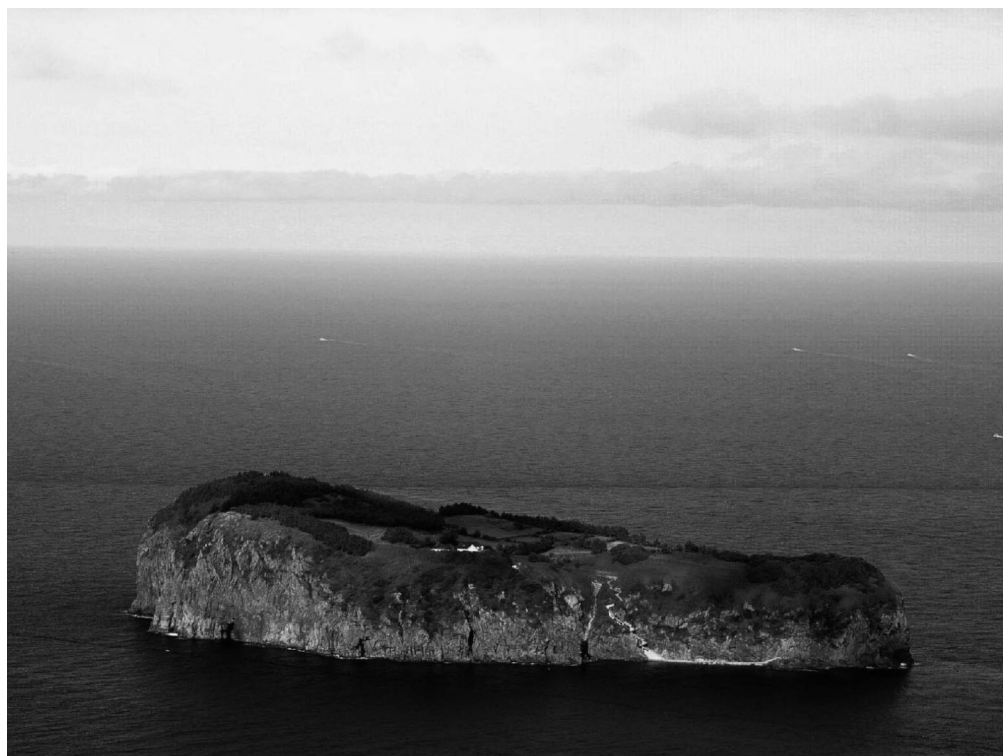
写真4-18 竹嶼（韓国名竹島）の西側からの全景