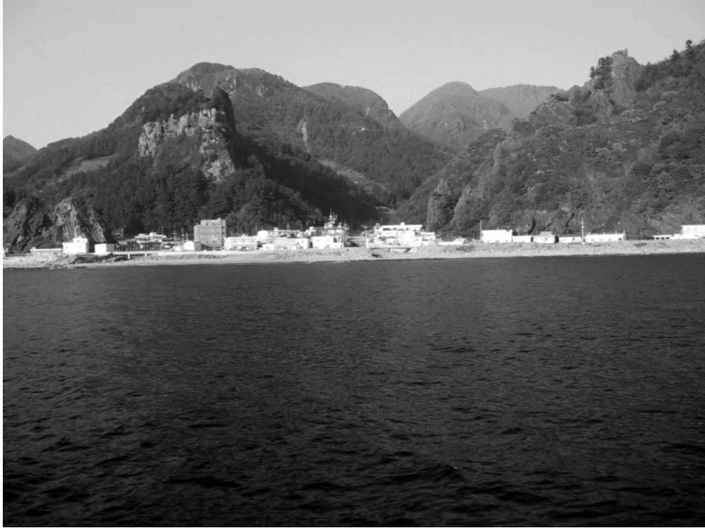
写真4-9 南陽（観光船より撮影）