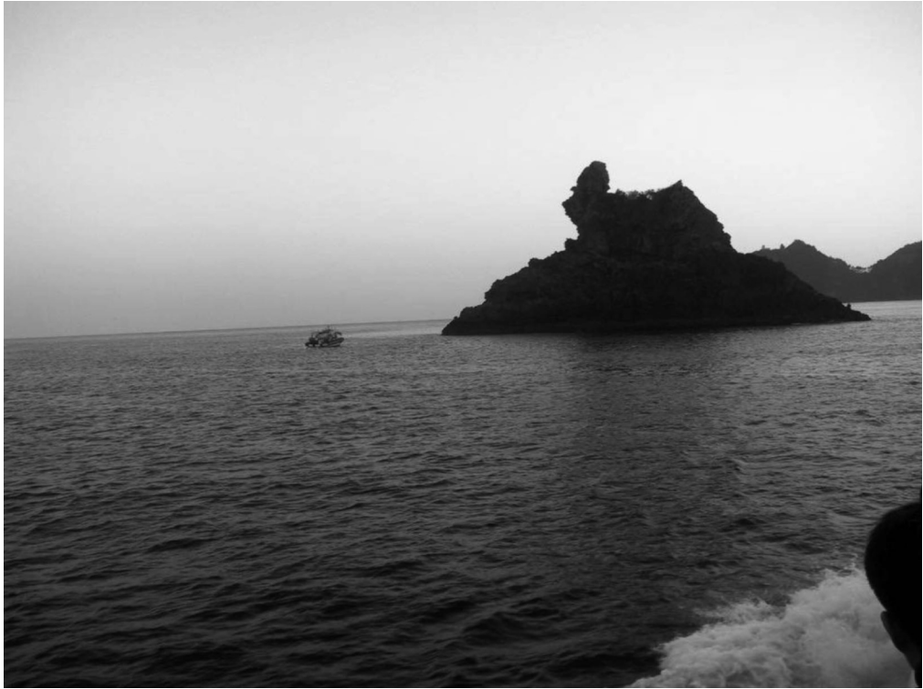
写真4-19 胃島（北苧岩）（観光船より撮影）