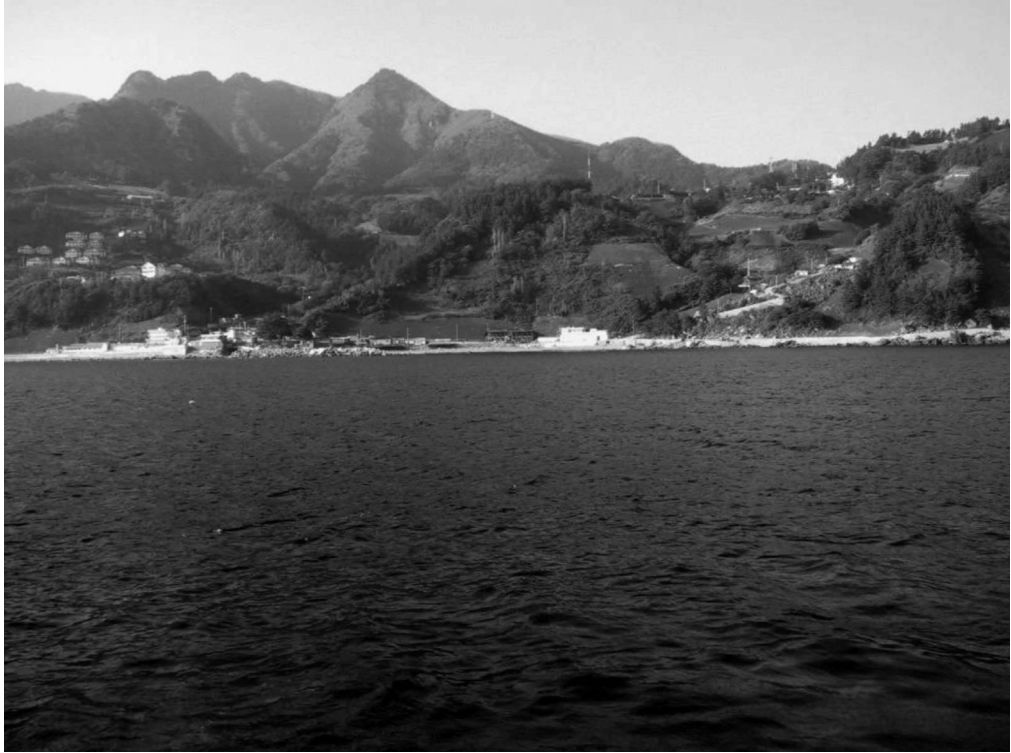
写真4-11 沙洞（観光船より撮影）