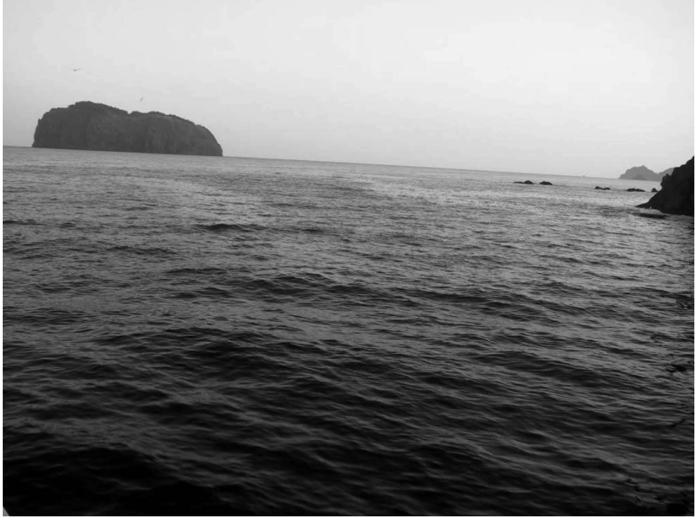
写真4-3 竹嶋（韓国名竹島）（観光船より撮影）