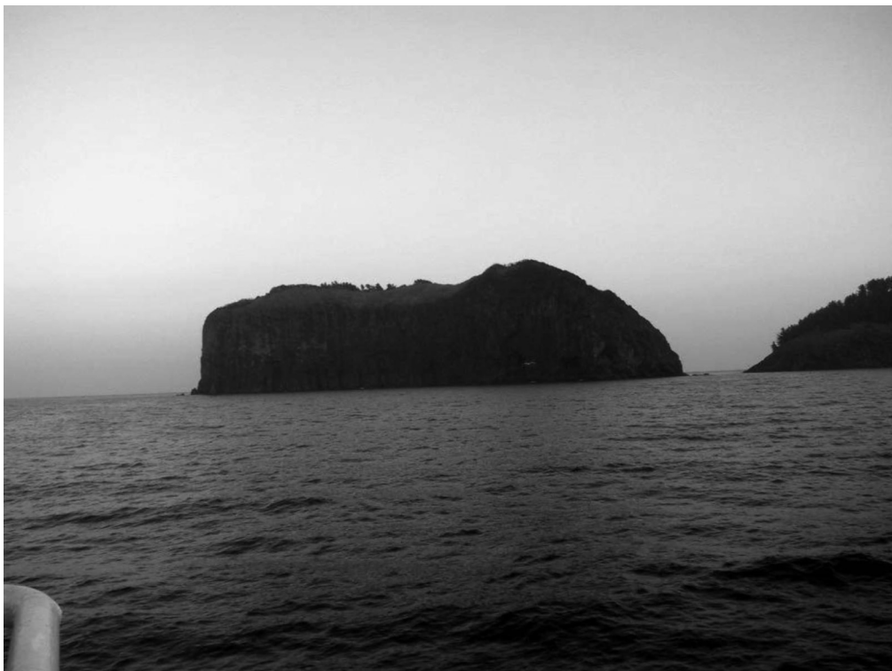
写真4-10 観音島（観光船、北側から撮影） 島の上は平坦となっており、樹木が生えていることが分かる。