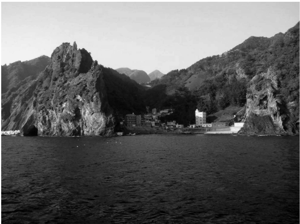
写真4-12 通九味（観光船より撮影） 写真左手に洞窟がみえる。岩の色が赤くなっている。