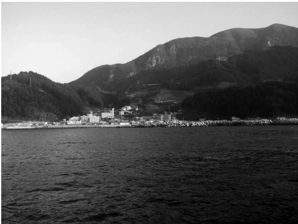
写真4-6 天府（観光船より撮影）