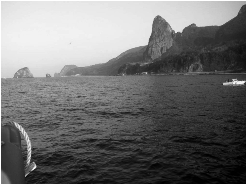
写真4-16 錐山（右）と孔岩（左）（観光船より撮影）