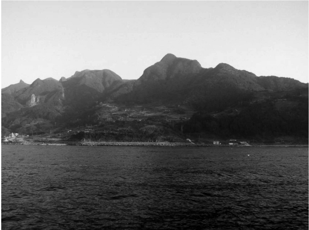
写真4-7 玄圃（観光船より撮影）