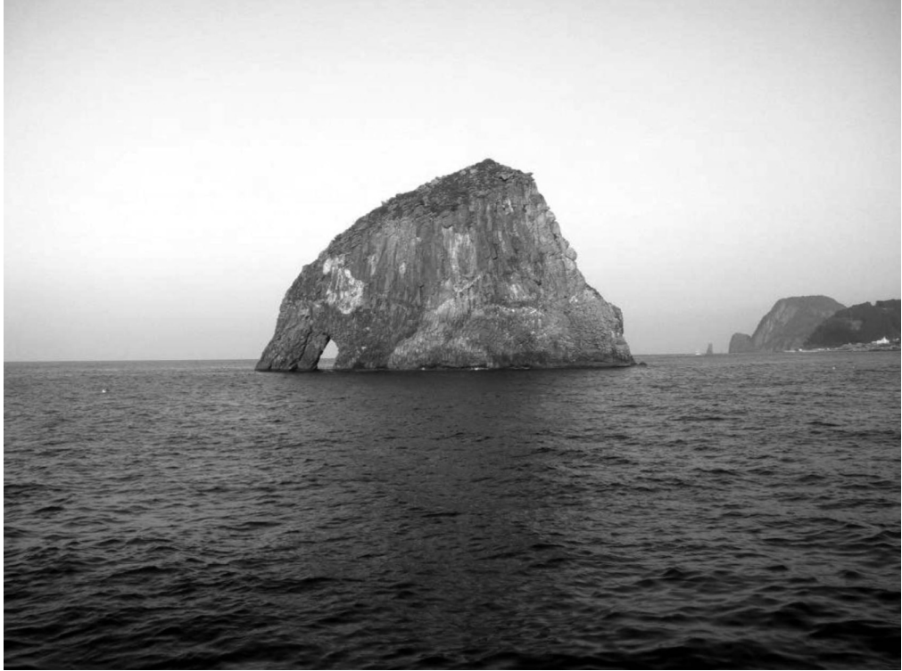
写真4-15 孔岩（観光船より撮影）